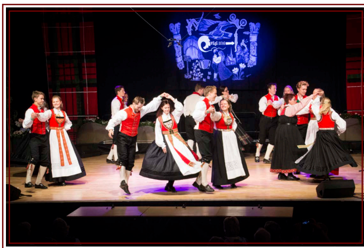
Hardanger Spelemannslag tevlar i lagdans under Landskappleiken 2016.

Formålet med ei satsing på folkedans i Hordaland er å leggja til rette for gode vekst- vilkår, auka interesse og forståing for tradisjonsdansen. Hovudprosjektet vil vera med å bidra til eit løft og bygga opp miljøa og aktiviteten i fylket. Det skal også bidra til å gjera folkedansen frå Hordaland meir synleg for innbyggjarane i fylket, men også på nasjonalt