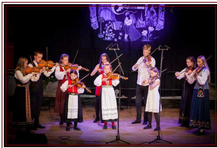
Bergen juniorspelemannslag i aksjon under Landskappleiken 2016, der dei vann sin klasse.